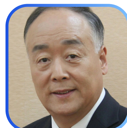
杨进教授 (中国常驻联合国教科文组织原大使代表 联合国教科文组织终身学习研究所理事会成员) 华东师范大学